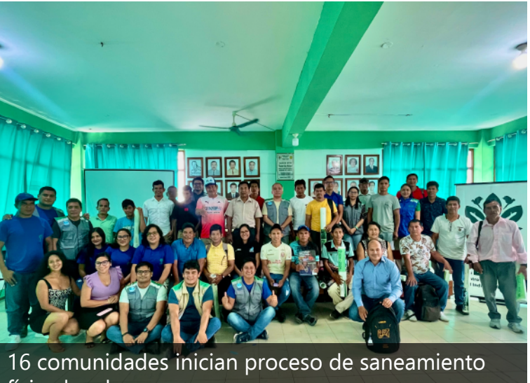
16 comunidades inician proceso de saneamiento físico legal para asegurar sus territorios comunales Más info