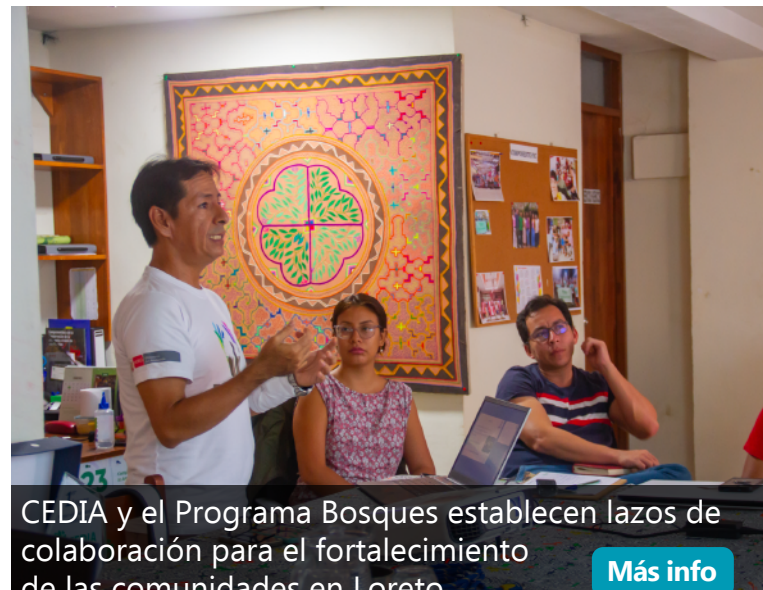
CEDIA y el Programa Bosques establecen lazos de colaboración para el fortalecimiento de las comunidades en Loreto Más info