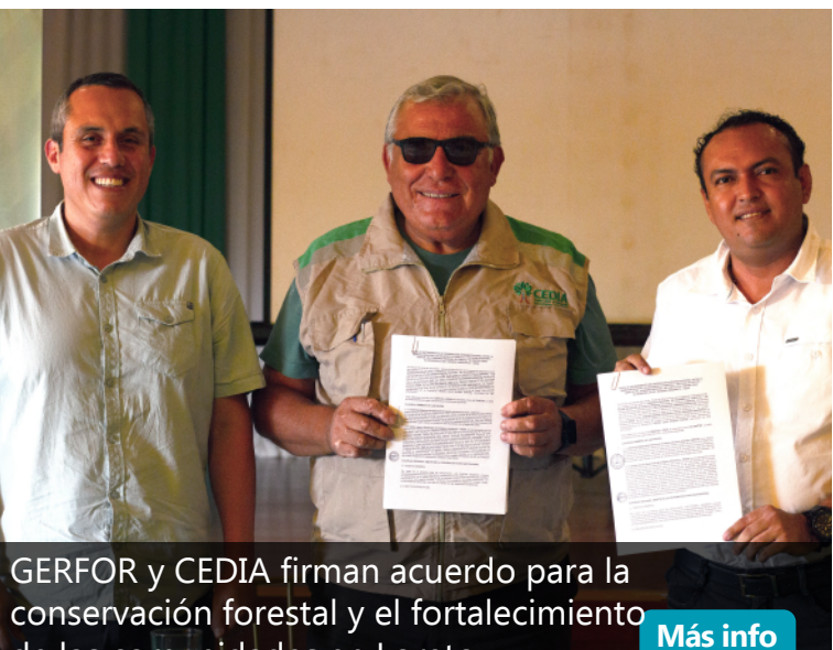
GERFOR y CEDIA firman acuerdo para la conservación forestal y el fortalecimiento de las comunidades en Loreto Más info