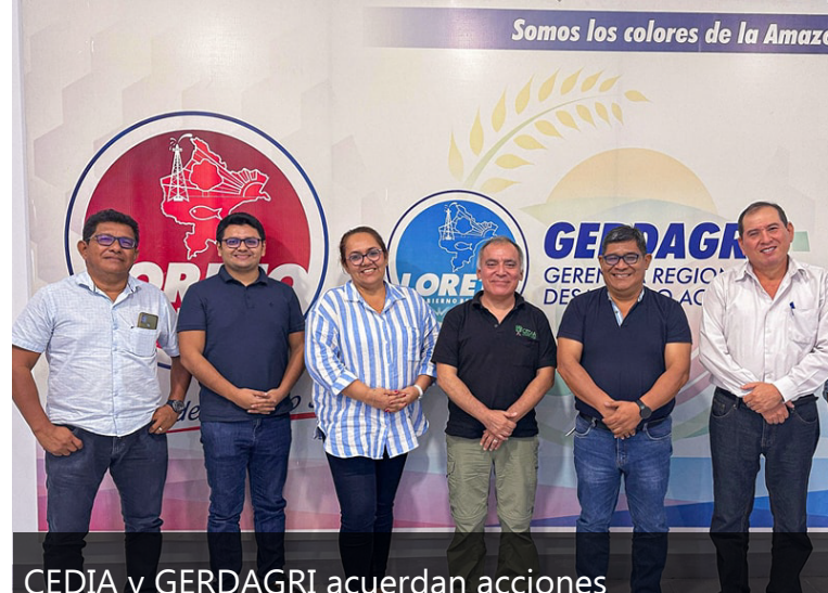
CEDIA y GERDAGRI acuerdan acciones para el 2024 Más info