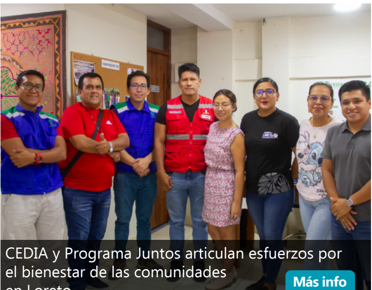
CEDIA y Programa Juntos articulan esfuerzos por el bienestar de las comunidades en Loreto Más info