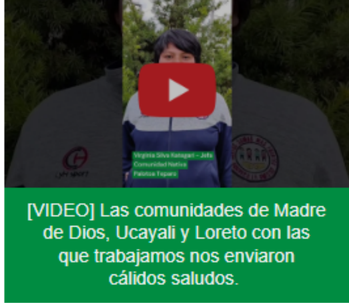
[VIDEO] Las comunidades de Madre de Dios, Ucayali y Loreto con las que trabajamos nos enviaron cálidos saludos.