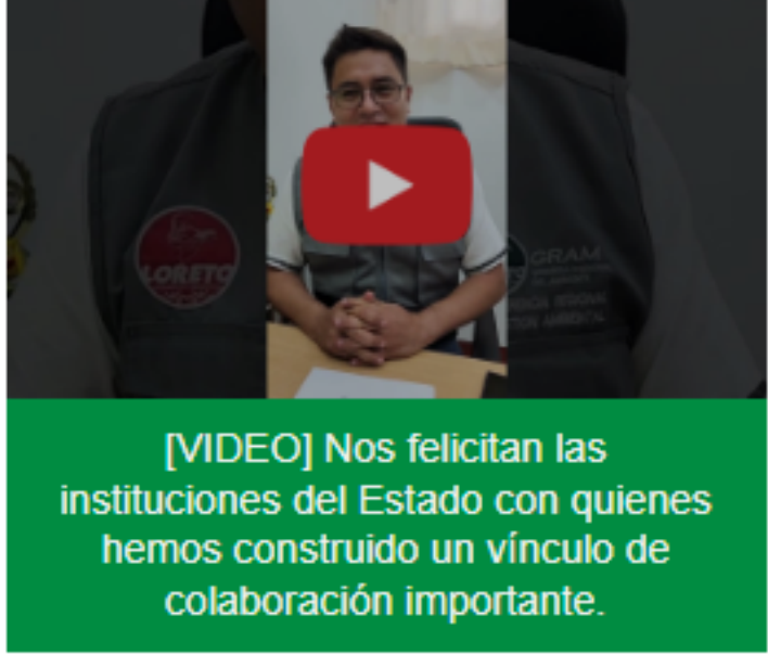
[VIDEO] Nos felicitan las instituciones del Estado con quienes hemos construido un vínculo de colaboración importante.