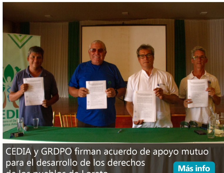
CEDIA y GRDPO firman acuerdo de apoyo mutuo para el desarrollo de los pueblos de Loreto Más info