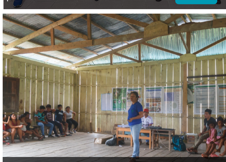
Comunidades del río Tapiche avanzan en proyecto de comercialización del aguaje Más info