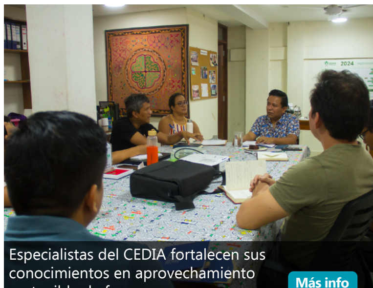
Especialistas del CEDIA fortalecen sus conocimientos en aprovechamiento sostenible de fauna Más info