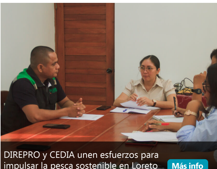
DIREPRO y CEDIA unen esfuerzos para impulsar la pesca sostenible en Loreto Más info